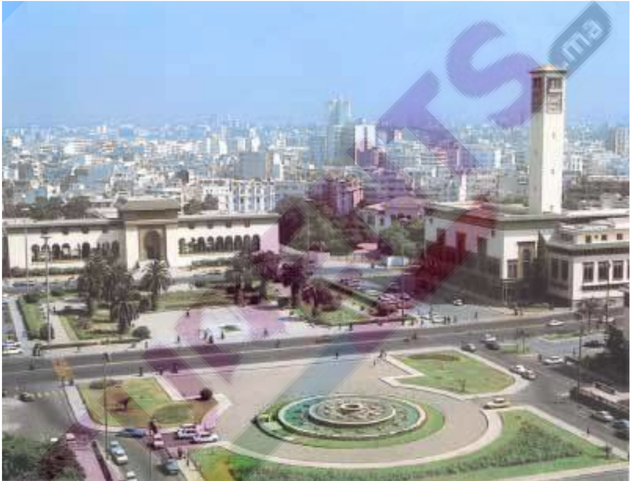
Vue de la Place Mohamed V, Casablanca