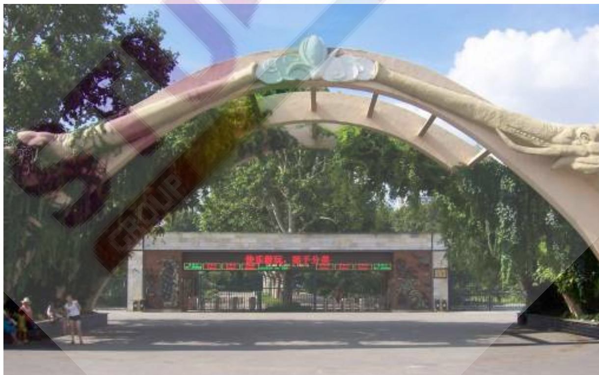
Entrée d'un zoo en Chine