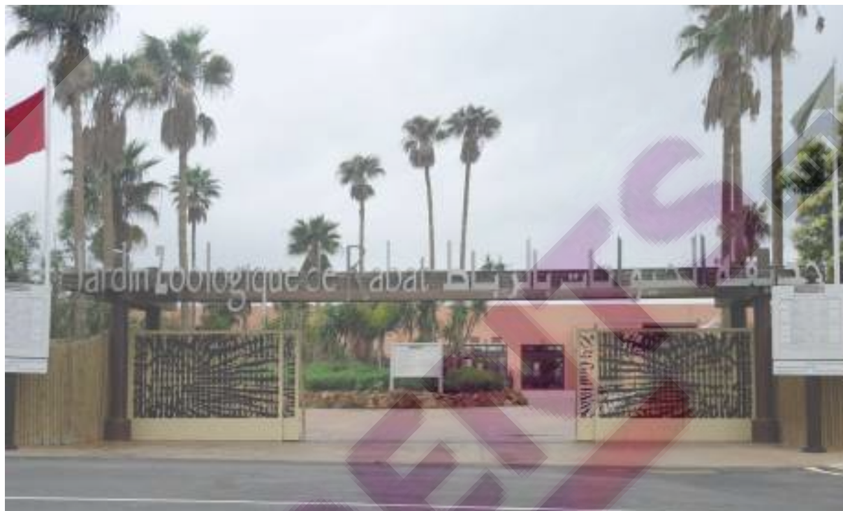
Entrée du zoo de Rabat