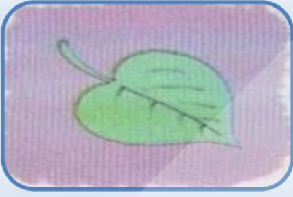
ورقة على شكل رمح