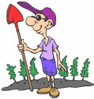
dans le jardin