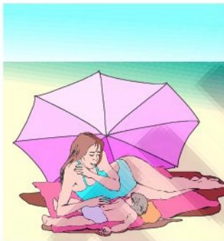
sous le parasol